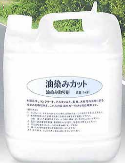
T-081 NET.Wt. 4.8kg

コンクリート、アスファルト、石材、木材等の油分に因る油染みを取り除き、これらの表面を均一化させる処理剤です。