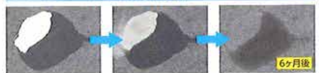
油圧オイルの染み跡処理。

エコエストジャパン株式会社 大阪府守口市寺方元町3-4-10 TEL: 06-6992-3313 FAX: 06-6992-3358 URL: http://www.ecoestjapan.co.jp