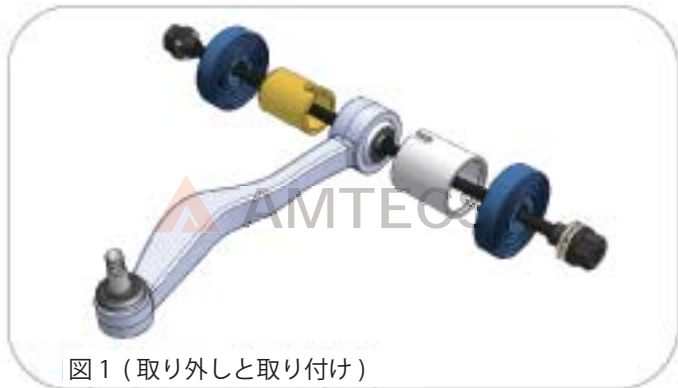
図 1 (取り外しと取り付け)

油圧プレス上で使用する場合、A & B プレートを傷めないためにプレスアダプタを使用してください。(図 2 参照)